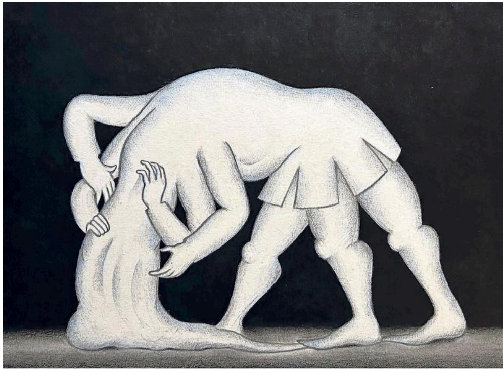
Werk van Rens Krikhaar.